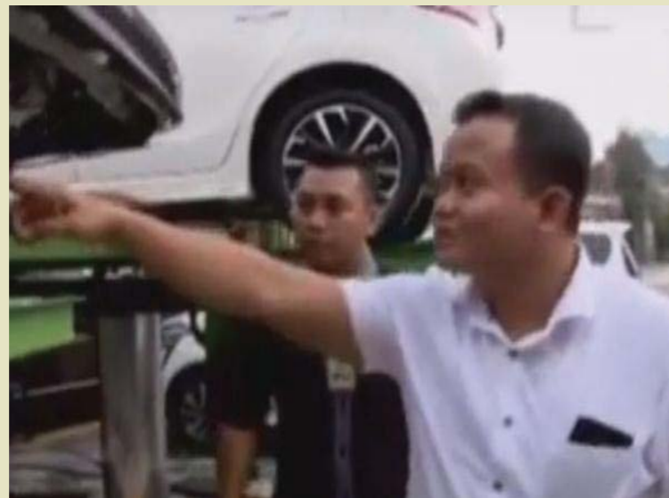
Foto: Tukang Ojek Jadi Pengusaha Cuci Mobil Water Snow

mendapatkan sebuah tabung snow yang sudah rusak. Rasa penasaran mulai menyelimutinya. Ia pun kemudian membawa tabung tersebut ke bengkel las dan membelah tabung tersebut. Saat itu ia ingin tahu bagaimana isi atau bagian dalam dari tabung tersebut.