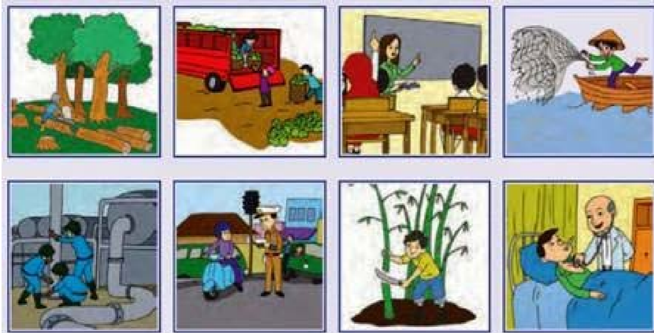
Gambar : membedakan-pekerjaan-yang-menghasilkan

Pilihlah 2 (dua) pekerjaan yang Anda sukai dan tuliskan masing-masing satu paragraf tentang pekerjaan tersebut!